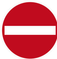
Verbot der Einfahrt